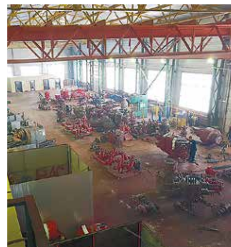
Нефтеюганский участок сегодня