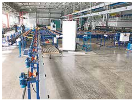
На фото: линия в «Сургутнефтегазе». Такая же скоро появится в «Удмуртнефти»

«...Учтены все требования, предъявленные специалистами НГДУ «Нижнесортимскнефть»... Немаловажную роль сыграло то, что в эксплуатации вашей компании находятся собственные технологические линии по ремонту насосных штанг и накоплен значительный опыт в этой области. НГДУ «Нижнесортимскнефть» благодарит сотрудников «ТМС групп» и рекомендует вас будущим заказчикам, как надежного партнера», - говорится в письме.