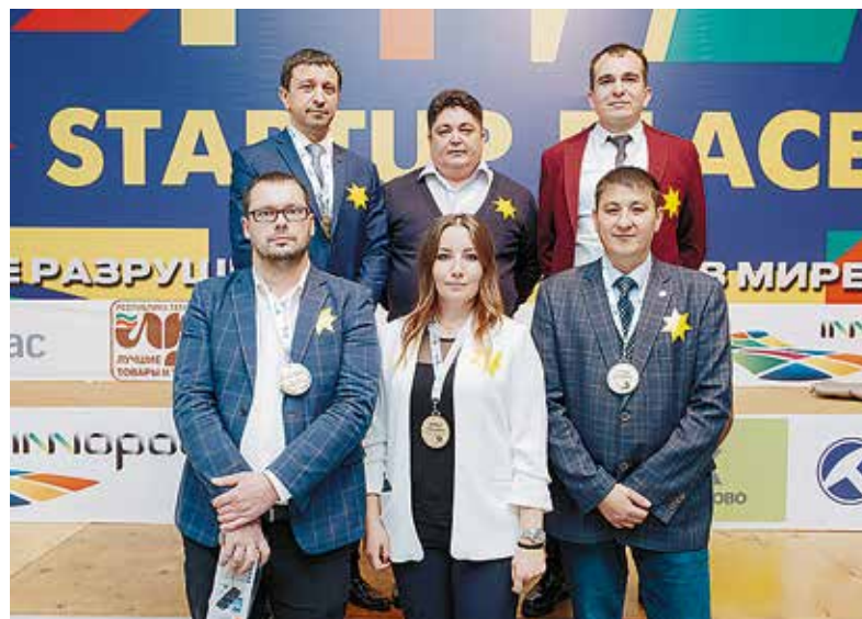
Команда «желтых» в золотых звездах

шо они чувствуют и понимают друг друга. В четвертом конкурсе снова была командная работа: в «Принципе пилы» оценивалась готовность маркетологов правильно выстраивать диалог с заказчиком, умение вести переговоры и шаг за шагом раскрывать желания заказчика. В последнем, пятом конкурсе участникам команд перед лицом жюри и зрителей пришлось показать навыки работы с возражениями и в за-