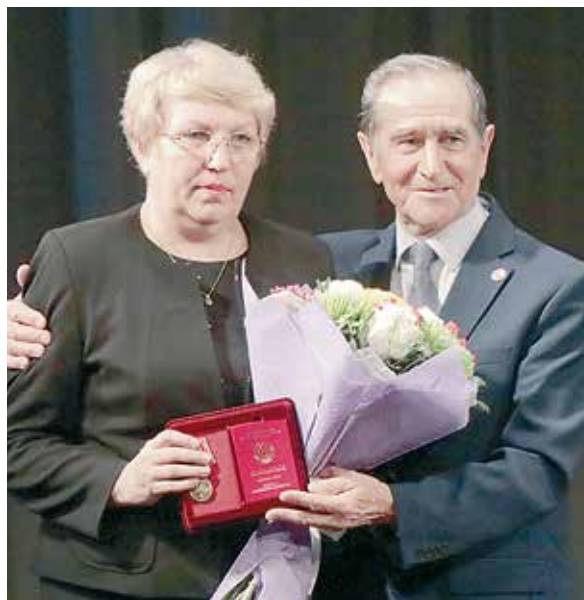
Достойная награда достойной представительнице компании

16 октября в Альметьевском татарском государственном драматическом театре прошла юбилейная конференция Совета местной общественной организации ветеранов (пенсионеров) Альметьевского муниципального района. В этом году организация отмечает свое 40-летие. Альметьевский Совет ветеранов является одной из наиболее деятельных и самых многочисленных общественных ветеранских организаций Республики Татарстан. В ее состав входит 106 первичных организаций. Общественная организация ветеранов ведет целенаправленную работу по повышению продолжительности и качества жизни пожилых граждан. В торжественной обстановке состоялось награждение активистов-лидеров пер-