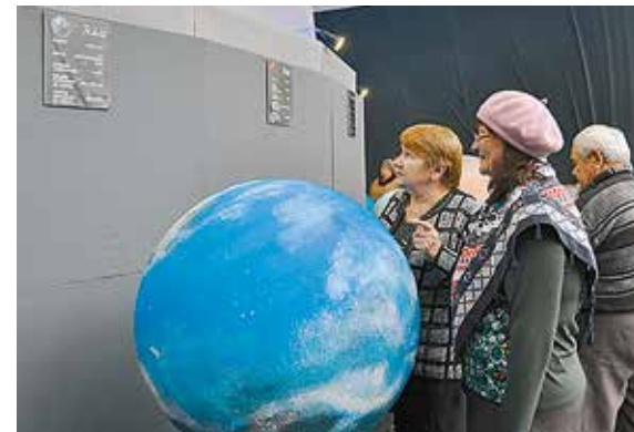
Планетарий вызывает интерес и у детей, и у взрослых