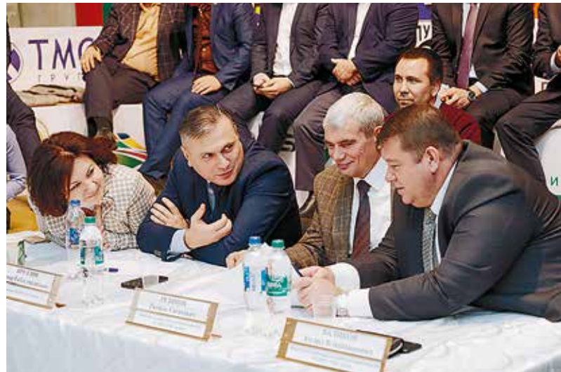
Начало на стр. 1