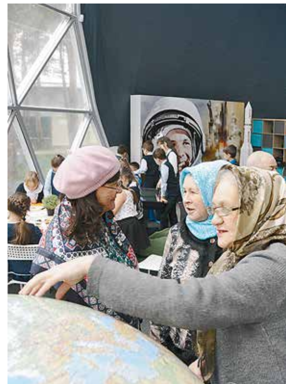
От увиденного пенсионеры были в восторге, словно вновь стали пионерами, готовыми к новым открытиям