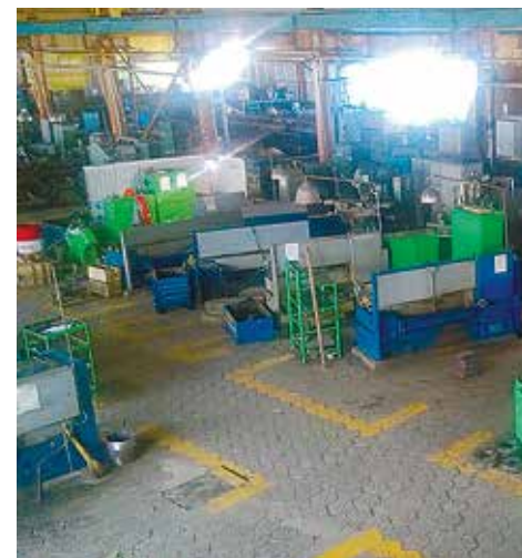
Так выглядел один из цехов «ТМС-Ямал» в 2015 году

АВТОР: Гульназ ЗАКИРОВА