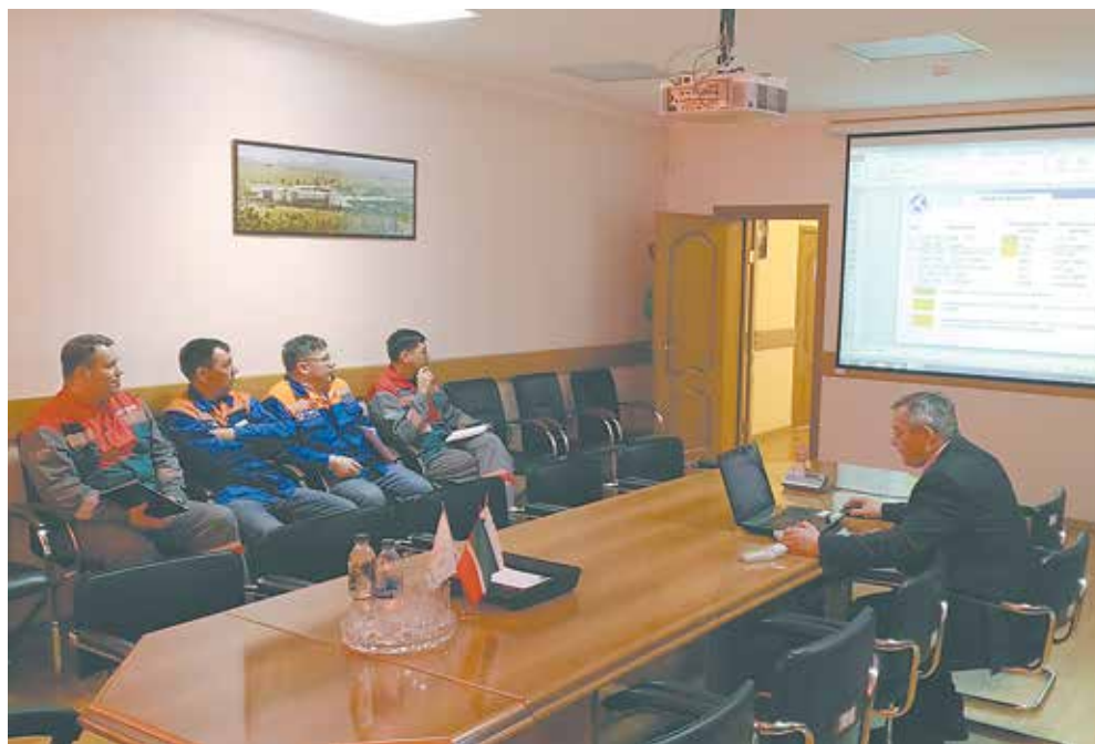
Обучение мастеров базировалась в том числе и на практических примерах

Т главной стратегической целью компании является построение эффективно действующей системы безопасности труда, направленной на обеспечение защиты жизни и здоровья персонала от возможных производственных рисков. Ключевым звеном данной системы являются непосредственные руководители, а именно мастера-линейные руководители участков. От уровня знаний, компетенции и даже настроения данных специалистов зависит атмосфера в коллективе, производительность и безопасность труда. В связи со снижением объема академических часов по курсам «Охрана труда» в высших учебных заведениях, упрощением обучения и проверки знаний в центрах подготовки кадров, возникает дефицит знаний в области безопасности труда руководителей и специалистов. Для поддержания необходимого уровня знаний в компании и в управляемых организациях система-